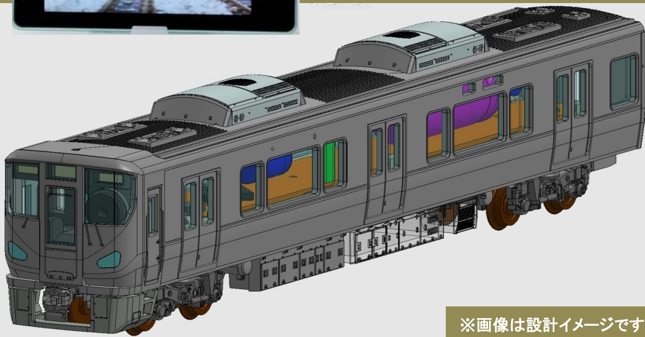
※画像は設計イメージです