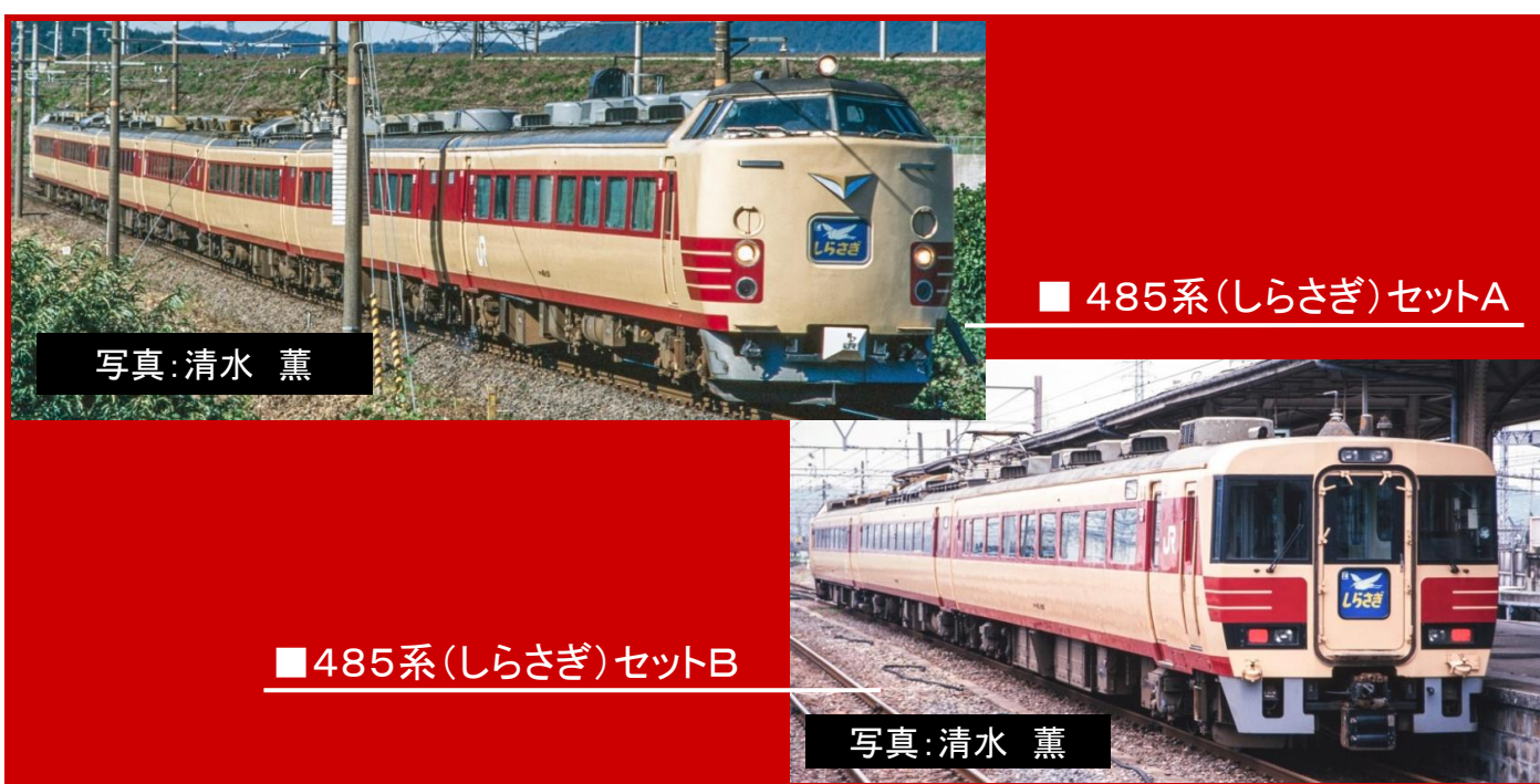
■ 485系(しらさぎ)セットA