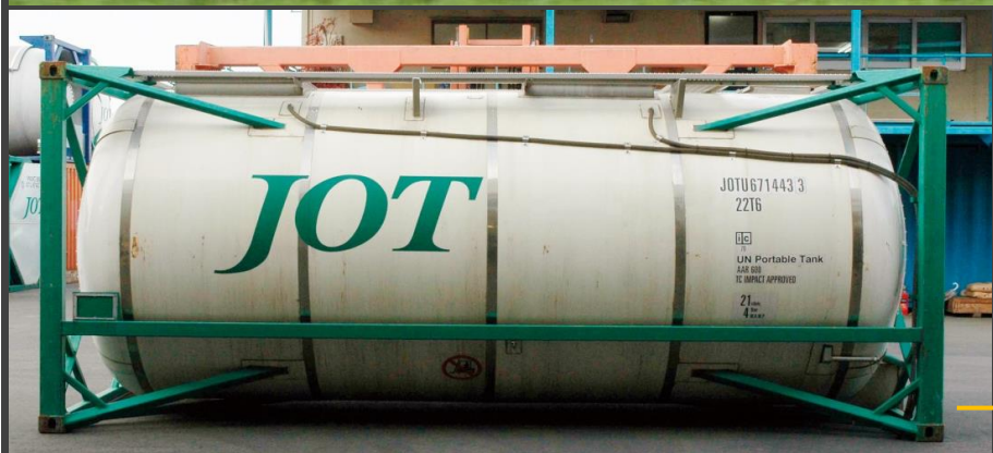
■私有 ISO20ftタンク コンテナ