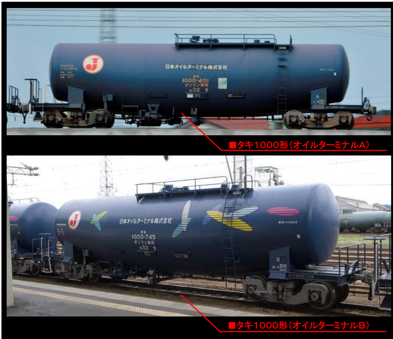
■タキ1000形(オイルターミナルA)