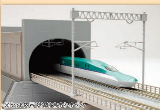
※セット内容以外は含まれません