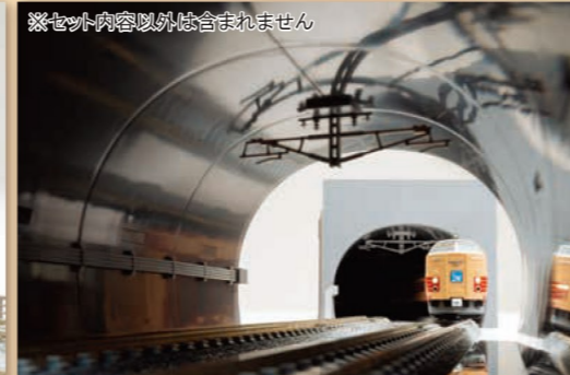
※セット内容以外は含まれません