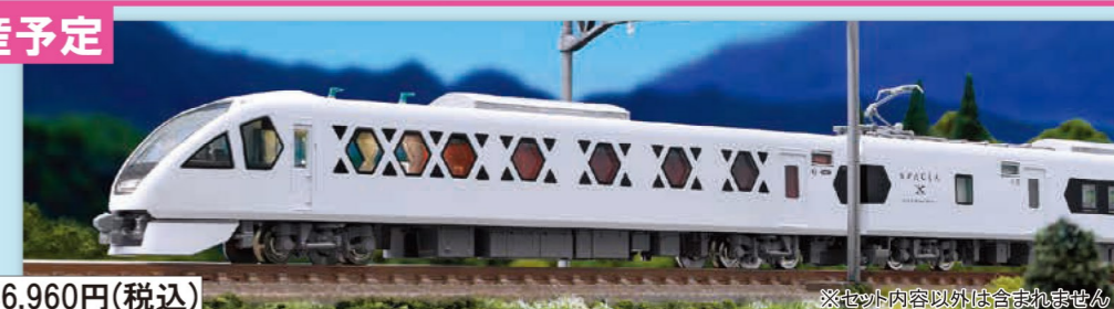
※セット内容以外は含まれません