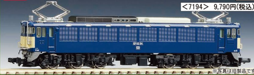
※写真は旧製品です