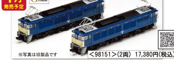
※写真は旧製品です