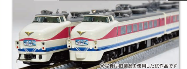
※写真は旧製品を使用した試作品です

High Grade <98594>基本(5両) 28,270円(税込) <98595>増結(4両) 16,720円(税込)