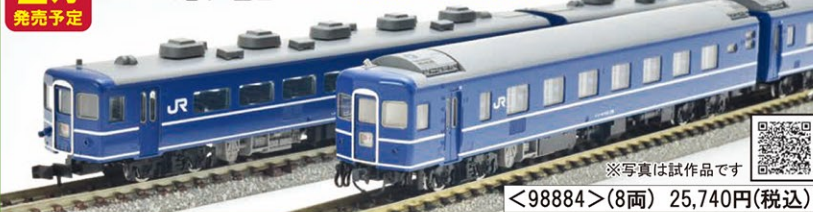
※写真は試作品です