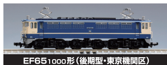
EF651000形(後期型・東京機関区)