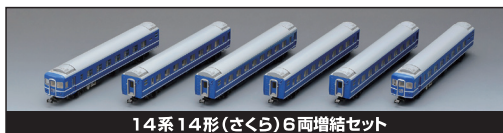
14系14形(さくら)6両増結セット