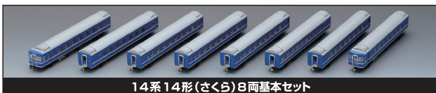
14系14形(さくら)8両基本セット