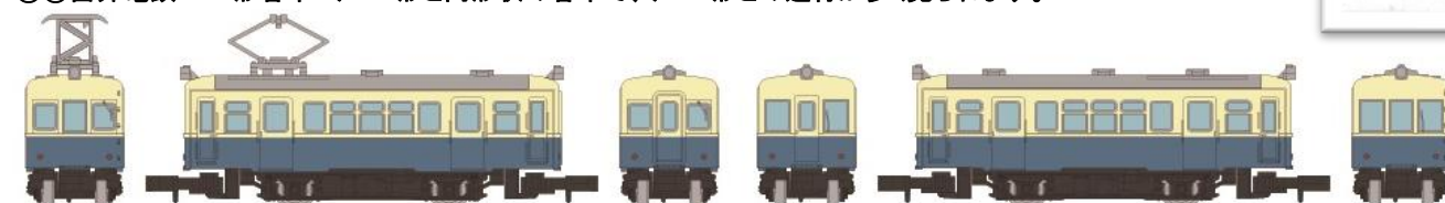
⑨⑩富井電鉄 デハ1000形 クハ3000形 富井～木村温泉間のシャトル運用に使用される電車です。どちらも両運転台車で、片側は貫通路付、片側非貫通の形態です。日中はデハ1両、朝夕はクハを増結し2両以上で運用されています。