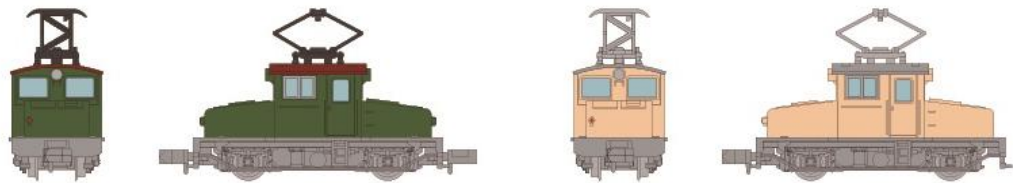
①②富井化学工業 凸型電機機関車EB形 従業員専用通勤列車の牽引や、富井電鉄との貨物の受け渡しに活躍。