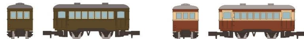
⑦⑧富井電鉄 ハ1形客車 デハ1形と同形状の客車で、デハ1形との運行が多く見られます。