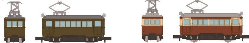
⑤⑥富井電鉄 デハ1形電車 木造の2軸電車で、ハ1形客車を従え、2連での運行が多く見られます。