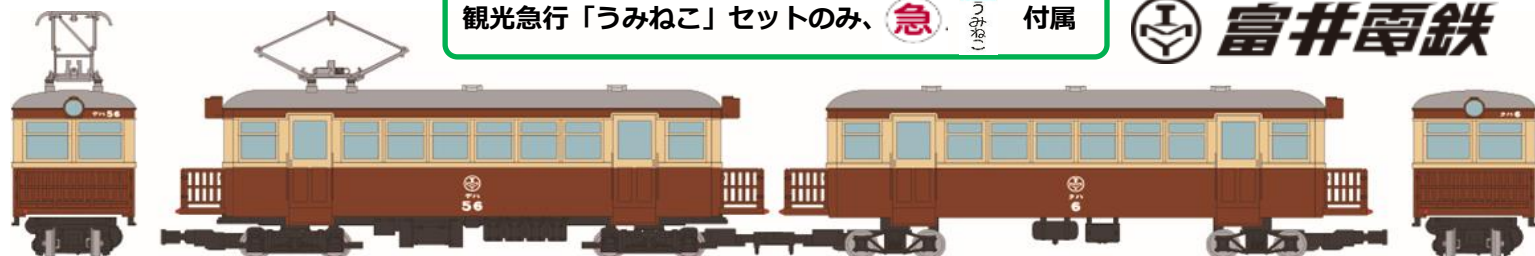
▲鉄道コレクション ナローゲージ80 猫屋線 観光急行「うみねこ」 デハ56 + クハ6 (旧塗装) 2両セット