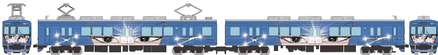
▲伊賀鉄道200系201編成(忍者列車青色)2両セットB