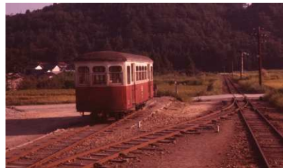
在りし日の尾小屋鉄道金平駅に佇む客車