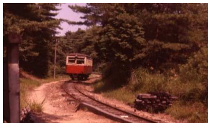
在りし日の尾小屋鉄道キハ1