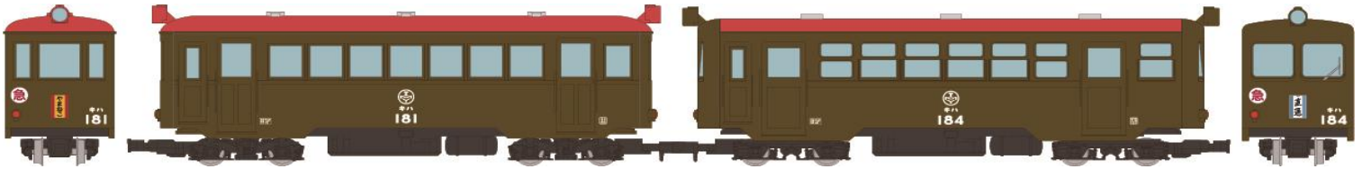
▲鉄道コレクション ナローゲージ80 猫屋線 直通急行「やまねこ」 キハ181・184 2両セット