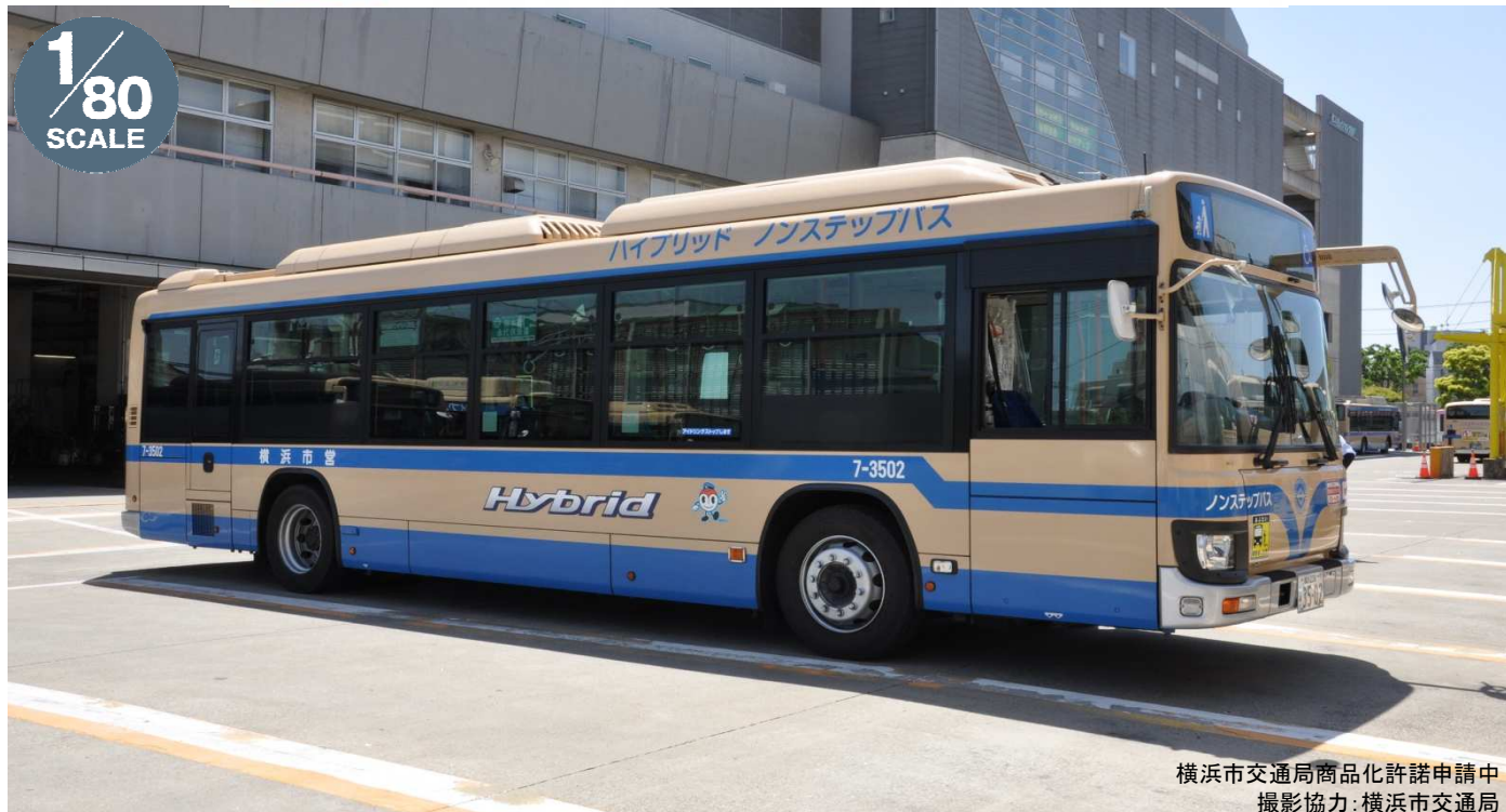
横浜市交通局商品化許諾申請中 撮影協力:横浜市交通局