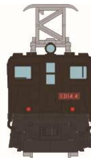
▲鉄道コレクション 国鉄ED14 (ED14 4タイプ)