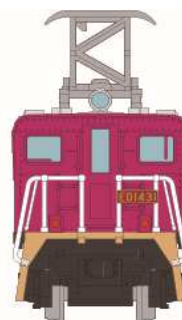
▲鉄道コレクション 富井電鉄ED14 31号機 ※実在しない車両です。