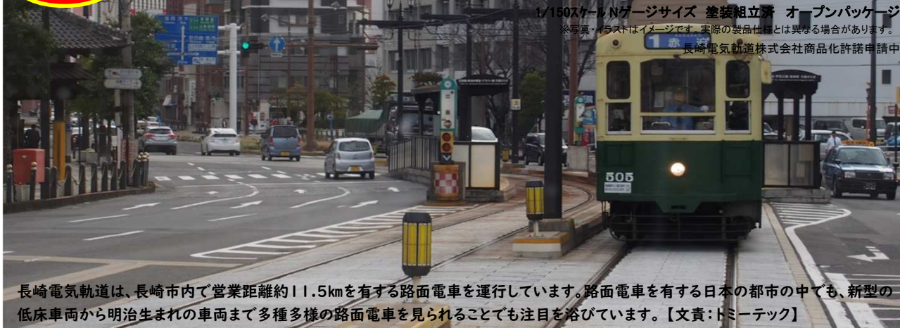
長崎電気軌道は、長崎市内で営業距離約11.5kmを有する路面電車を運行しています。路面電車を有する日本の都市の中でも、新型の低床車両から明治生まれの車両まで多種多様な路面電車を見られることでも注目を浴びています。【文責:トミーテック】

1/150スケール Nゲージサイズ 塗装組立済 オープンパッケージ ※写真・イラストはイメージです。実際の製品仕様とは異なる場合があります。 長崎電気軌道株式会社商品化許諾申請中