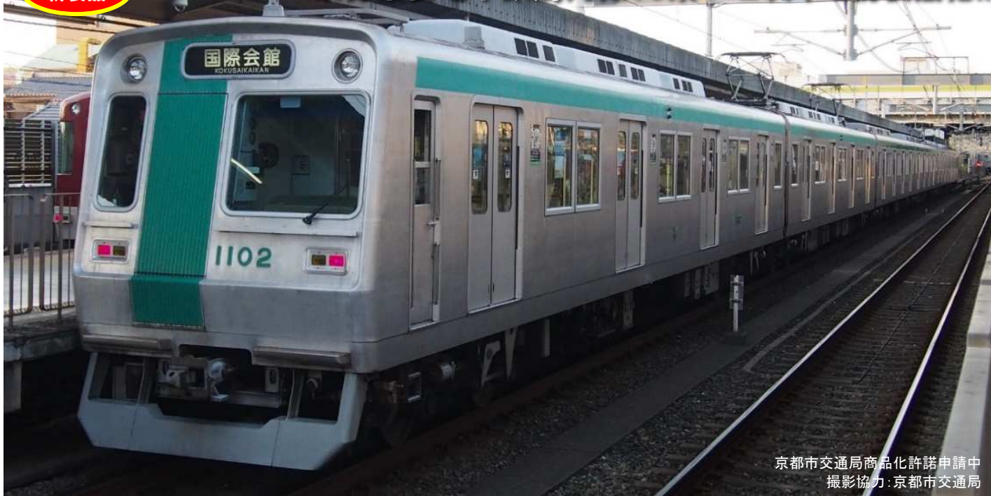
京都市交通局商品化許諾申請中 撮影協力：京都市交通局