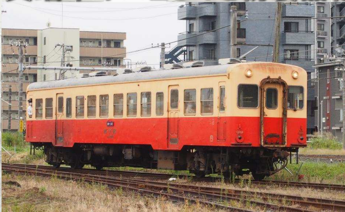
撮影協力: 小湊鐵道株式会社 小湊鐵道株式会社商品化許諾申請中