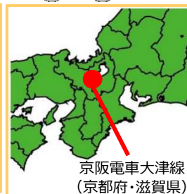
京阪電車大津線 (京都府・滋賀県)