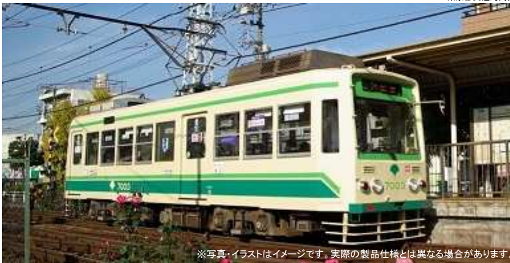
※写真・イラストはイメージです。実際の製品仕様とは異なる場合があります。

1/150スケール Nゲージサイズ 塗装組立済 オープンパッケージ 東京都交通局商品化許諾申請中