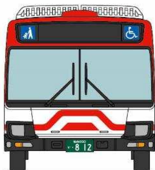
◆いすゞエルガ 仙台営業所所属◆