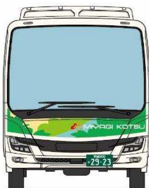
◆三菱ふそうエアロエース 富谷営業所所属◆