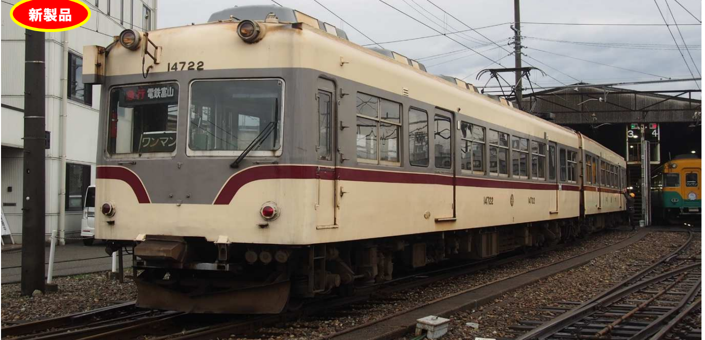
※写真・イラストはイメージです。実際の製品仕様とは異なる場合があります。