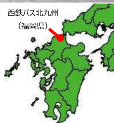
西鉄バス北九州 (福岡県)