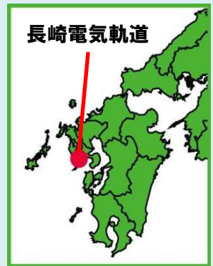
長崎電気軌道株式会社商品化許諾申請中

長崎電気軌道は長崎市内で営業距離約11.5kmを有する路面電車を運行しています。日本有数の観光地でもある長崎では、修学旅行の学生達や長崎港に寄港する海外からのクルーズ船、国内外から多くの観光客が訪れています。また、路面電車を有する日本の都市の中でも、新型の低床車両から明治生まれの車両まで多種多様の路面電車が見られることでも注目を浴びています。1500形車両は1993年から7両が登場しました。先に登場した1200・1300形と類似の外観デザインとなっていますが、シングルアームパンタグラフを搭載しています。今回は一般塗装の1501号と長崎の「スキ」を発信する長崎LOVERS広告車両となった1505号を同時発売します！【文責:トミーテック】 ※走行用パーツセットには対応していません。 動力ユニットはTM-TR01を指定、パンタグラフは<0246>PT-7113-Dを推奨します。 パッケージサイズ W170×H65×D40 (mm) ※原産地:中国 ※展示用台座は付属しません。