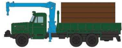
いすゞTWD/HTW(原木運搬車) +原木