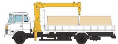
日野レンジャー(ユニック付き平ボディ) +製材