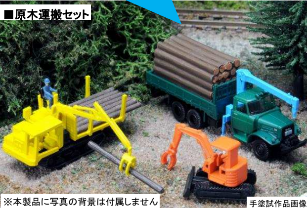
※本製品に写真の背景は付属しません