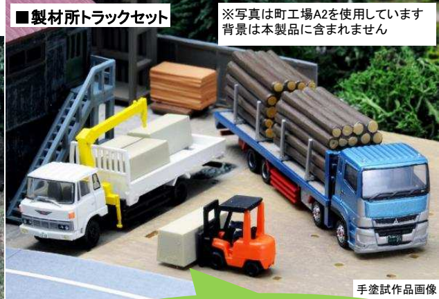
■製材所トラックセット