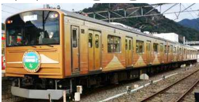
※画像のヘッドマークは付属しません