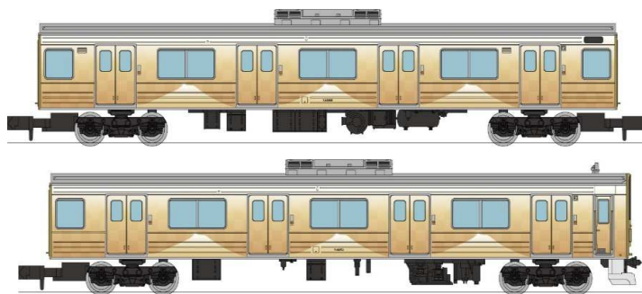
※写真・イラストはイメージです。実際の製品仕様とは異なる場合があります。

JR中央線との乗換駅である大月駅と河口湖駅間の26.6km、標高差約500mを登る「富士山に一番近い鉄道」富士急行は、1929(昭和4)年6月に大月駅-富士吉田駅(現:富士山駅)間の23.3kmが開業してから90周年を迎えました。開業90周年を記念して導入された6000系車両の外観は、市松柄とグラデーションの和モダンを基調としており、世界遺産「富士山」の雄大で優美な姿を金色で表現されております。鉄道コレクションでは、この記念すべき富士急行開業90周年記念車両を製品化いたします。どうぞご期待ください!