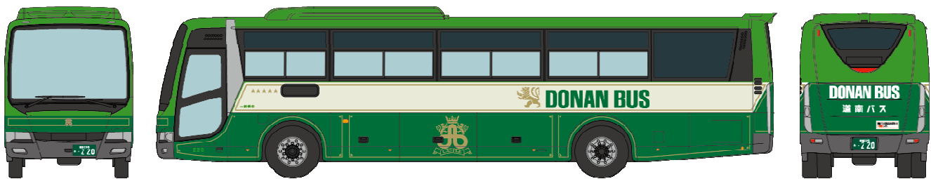
■道南バス 三菱ふそうエアロエース