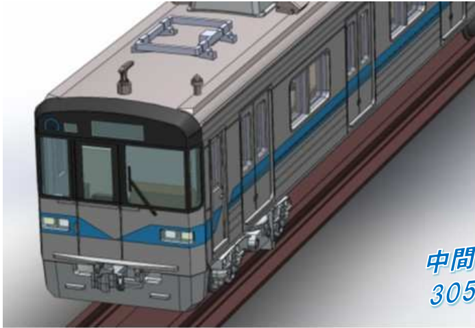
現行仕様の3050形6両セット