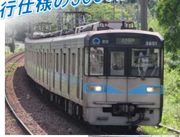
中間に3000形1次車を挟んだ 3050形3159編成6両セット