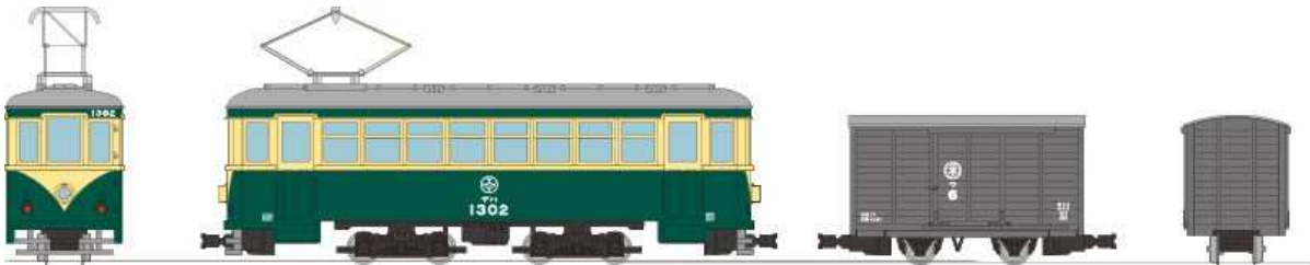
▲鉄道コレクション ナローゲージ80 猫屋線直通用路面電車+貨車セット