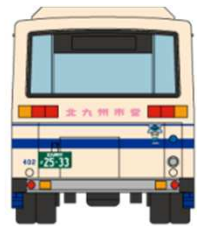
西日本車体工業58MC※一部実車と異なる箇所があります。