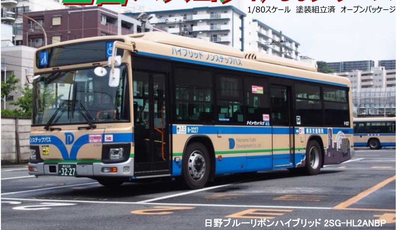
日野ブルーリボンハイブリッド 2SG-HL2ANBP