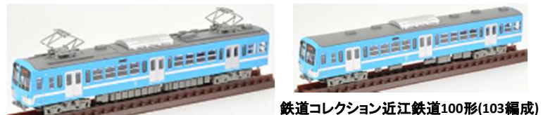
鉄道コレクション近江鉄道100形(103編成)

鉄道コレクションで発売中の近江鉄道100形(103編成)と並べて、また、TOMIXから発売のN700系各種、7003000系、2250系などと並べて、近江鉄道を楽しもう！