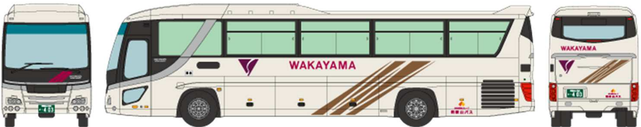
■ 和歌山バス 日野セレガ PKG-RU1ESAA