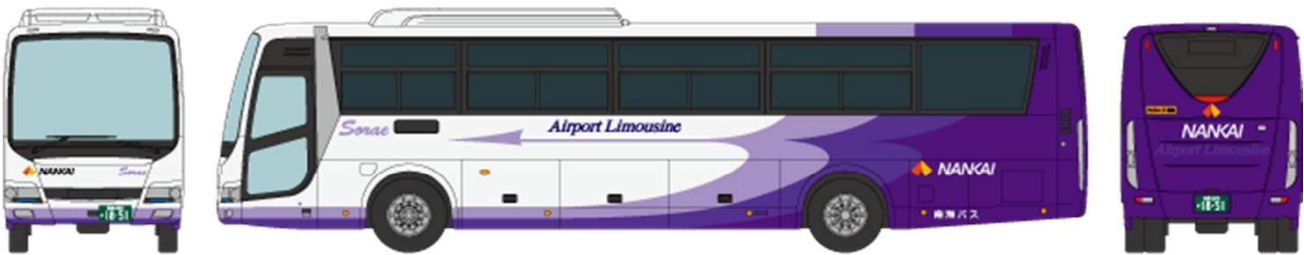
■ 南海バス 三菱ふそうエアロエース QTG-MS96VP