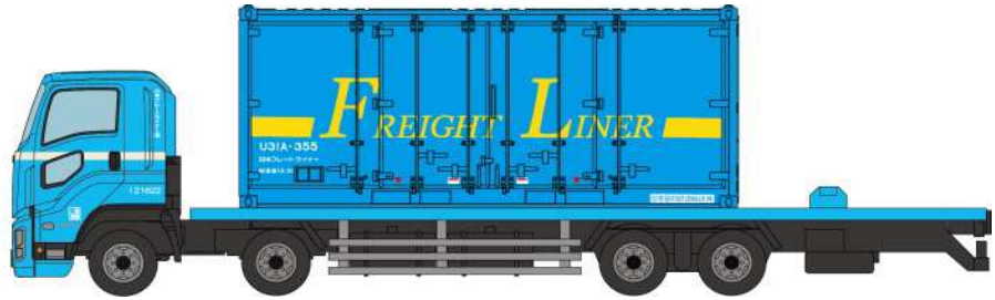
いすゞ ギガ コンテナ車(U31A形コンテナ)