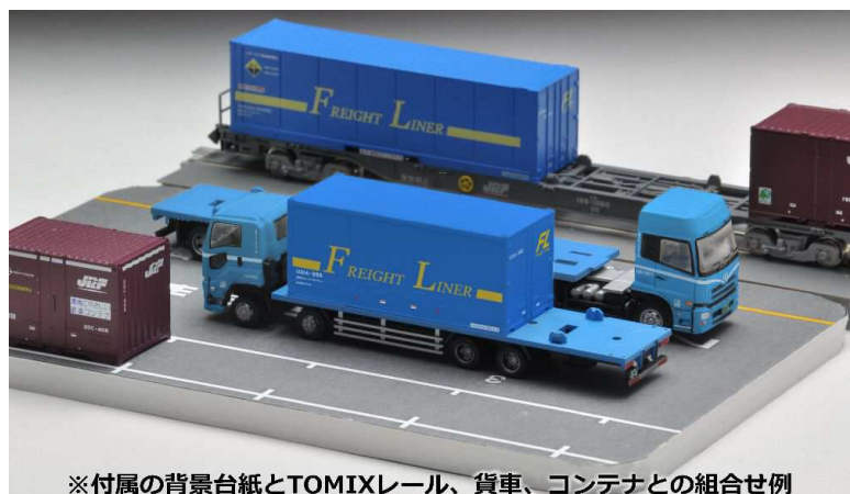
※付属の背景台紙とTOMIXレール、貨車、コンテナとの組合せ例