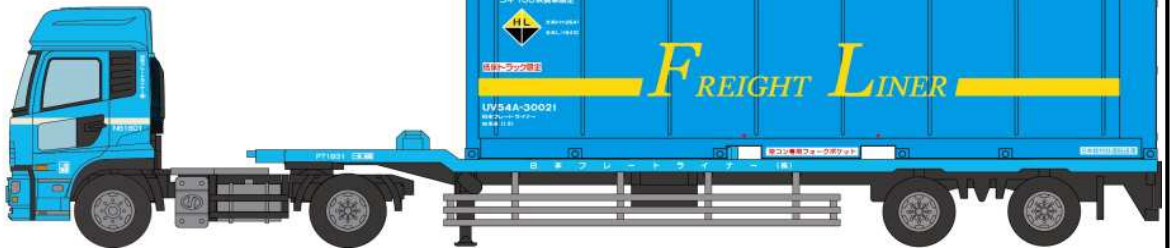
UDトラックス クオン コンテナトレーラー(UV54A-30000形コンテナ)