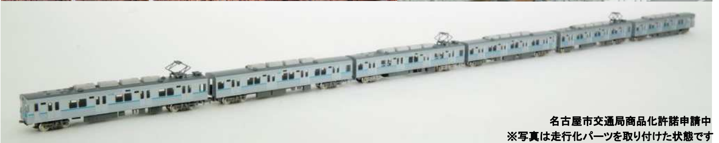
名古屋市交通局商品化許諾申請中 ※写真は走行化パーツを取り付けた状態で

名古屋市交通局鶴舞線3000形は1977年に誕生した名古屋市交通局初の冷房車、セミスステンレスの車両です。車両の計画段階から名鉄との相互直通運転を考慮し、仕様について車両寸法や性能などの統一を行っていました。1977年の伏見～八事間開業時及び1979年名鉄豊田新線(現豊田線)との相互直通運転開始時は4両編成で活躍していましたが、1993年の名鉄犬山線との相互直通を機に6両編成に組み換えられ、後に中間に封じ込まれた先頭車は中間車改造されました。3000形は2012年より徐々に廃車が始まり、現在6編成36両が活躍しています。製品では4次車の3123編成を製品化致します。