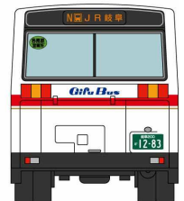
岐阜乗合自動車株式会社商品化許諾申請中 ※写真、イラストと実際の製品仕様とは異なる場合があります。