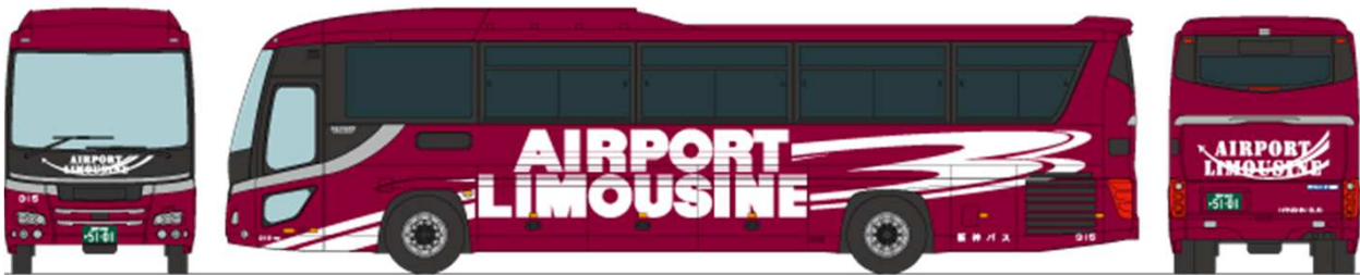
■阪神バス 日野セレガ 2RG-RU1ESDA