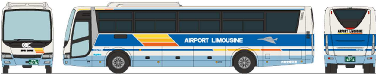
■大阪空港交通 三菱ふそうエアロエース QTG-MS96VP