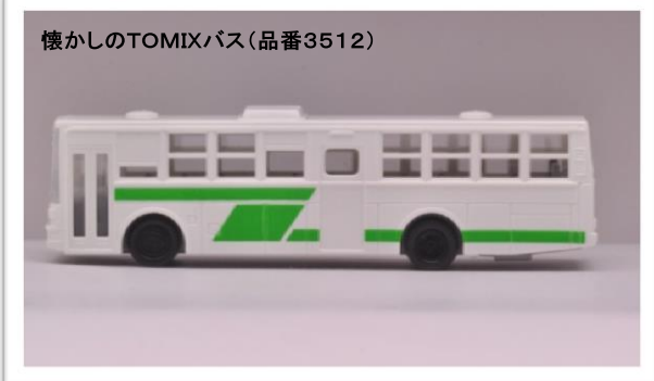
懐かしのTOMIXバス(品番3512)