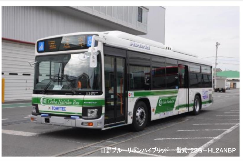
日野ブルーリボンハイブリッド 型式:2SG-HL2ANBP