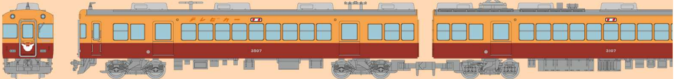
京阪電車3000系(2次車)4両セット