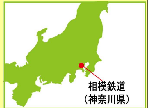
相模鉄道 (神奈川県)