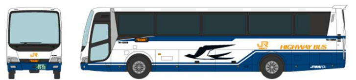
④ ジェイアール東海バス 三菱ふそうエアロエース QTG-MS96VP 新東名スーパーライナー(名古屋～東京線)