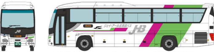
① ジェイ・アール北海道バス いすゞガーラ QTG-RU1ASCJ 札幌線 高速おたる号

バスコレ走行システム(別売) 専用動力 BM-03 JRバス8社全車種で取付可能