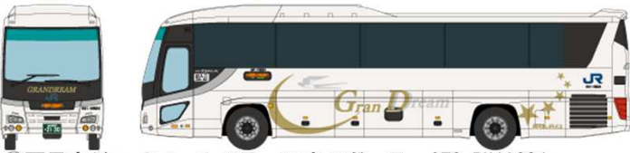
⑤ 西日本ジェイアールバス いすゞガーラ QTG-RU1ASCJ グランドリーム(東京～大阪線)