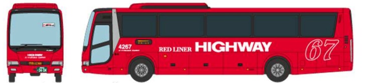
⑧ JR九州バス 三菱ふそうエアロエース QRG-MS96VP 福岡・山口ライナー(福岡・博多～宇部・山口線)