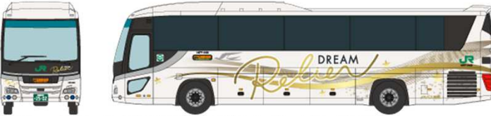
③ ジェイアールバス関東 日野セレガ LKG-RU1ESBA ドリーム ルリエ(東京～大阪線)