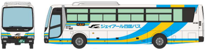
⑦ ジェイアール四国バス 三菱ふそうエアロエース QTG-MS96VP 高松エクスプレス大阪号(高松～大阪線)