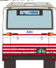
②広島バス 富士重工業7E U-MP618M [29]深川線 広島駅・大内越峠 (おちごとうげ) ・温品経由 小河原車庫行