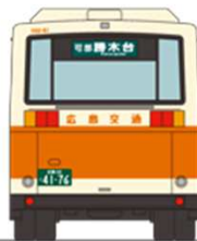
③広島交通 西日本車体工業58MC (B-II) KC-UA460NAN 勝木線 バスセンター・祇園・古市・可部経由 勝木台行

国内屈指のバスセンターである「広島バスセンター」は1957年（昭和32年）7月、全国初の一般バスターミナルとして、広島を中心地「紙屋町」に開業しました。本年7月に60周年を迎えるのを記念して「開業60周年記念セット」を発売します。セット内容は1990年代に製造された広島市内3社の自社発注車をラインナップ。広島電鉄・広島交通は西工58MC、広島バスは富士7Eをチョイスし、各社こだわりポイントを一部新規金型で再現。ツーステップ標準床にメロ窓の広島特有仕様の路線バスをお楽しみいただけます。