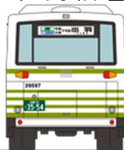
①広島電鉄 西日本車体工業58MC (B-I) U-MP618M 出羽線 可部・大林・千代田経由 出羽 (いずわ) 行 ※現在は廃止になっています