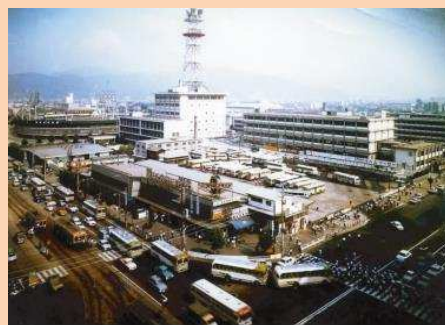
昭和40年代初頭の広島バスセンター全景 (旧広電ビルより)

* 別売のバスコレ専用動力ユニット【BM-02R】を組み込むことで専用道路での走行もお楽しみいただけます。