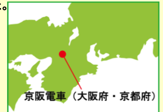
京阪電車 (大阪府・京都府)

京阪電車1900系は1963年の淀屋橋延伸開業に伴う特急増発のために登場した車両です。「新製車」と呼ばれるグループと1810系を改造編入した「編入車」と呼ばれるグループに分けられます。同形式の登場で京阪特急は空気ばね台車を装着する車両で統一されサービス面が大幅に向上しました。1971年に後継車の初代3000系が登場すると3扉化改造を施したうえで一般車に格下げされました。その後、冷房改造やリニューアル改造が施され2008年の完全引退まで最長52年の長きに亘って運行されました。この製品は特急時代 最盛期である1970年頃の姿をプロトタイプとしています。