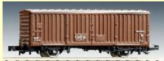
ワム280000 平成初期までは紙輸送以外でも使用されることがありました 沿線に製紙工場の多い東海道本線では化成品輸送のタンク車を連ねた貨物列車にワムが連なる姿がよく見られました