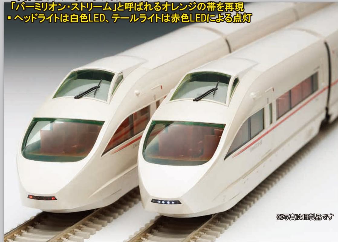
※写真は旧製品です