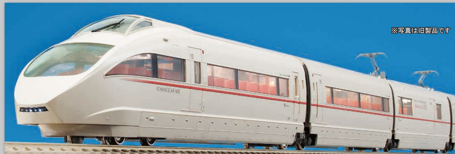
※写真は旧製品です