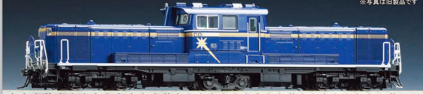
※写真は旧製品です