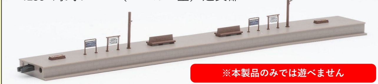
<4259>島式ホーム (ローカル型) 延長部