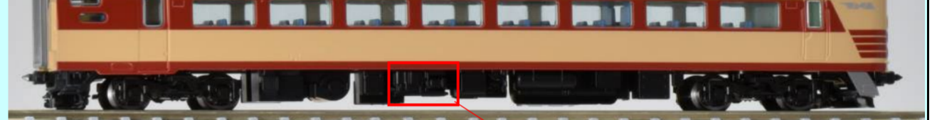
追加されたコンプレッサー