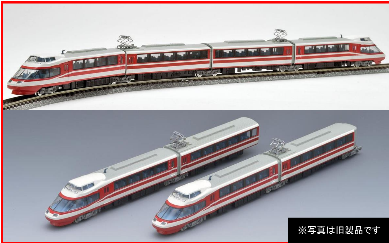
※写真は旧製品です