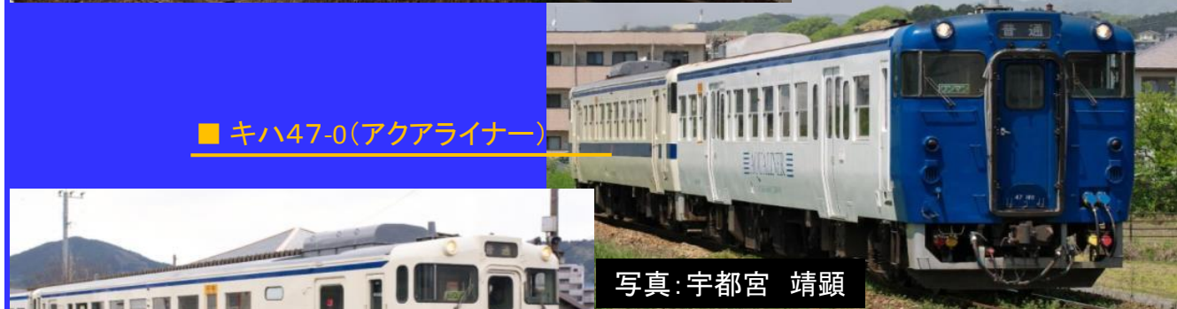
■ キハ47-0(アクアライナー)