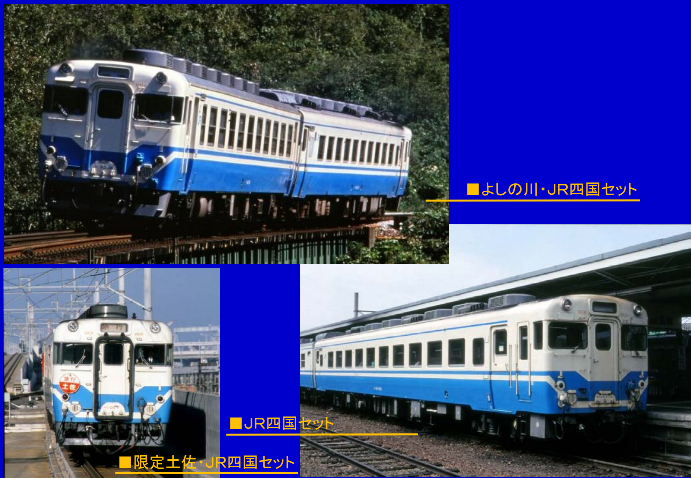
■よしの川・JR四国セット