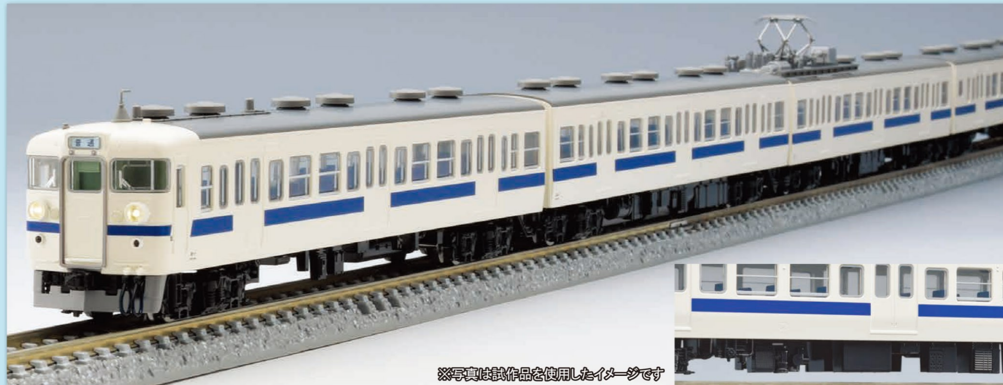
※写真は試作品を使用したイメージです